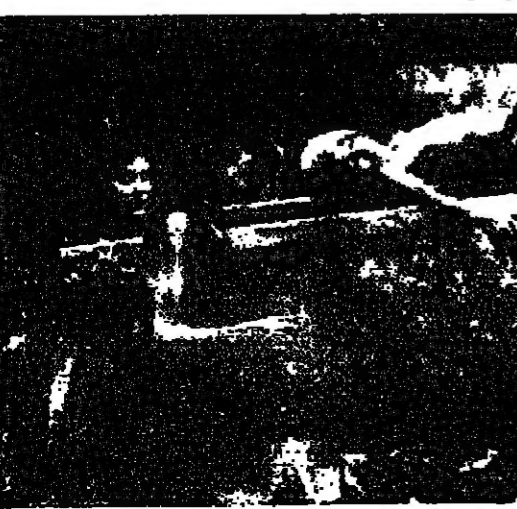
نقل احد ضحايا المجاعة